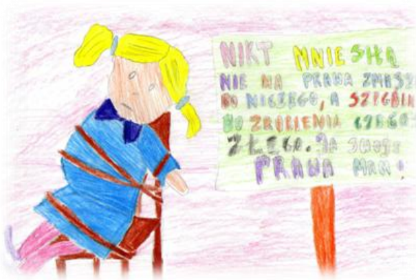
Beata Podgórska , kla. II b